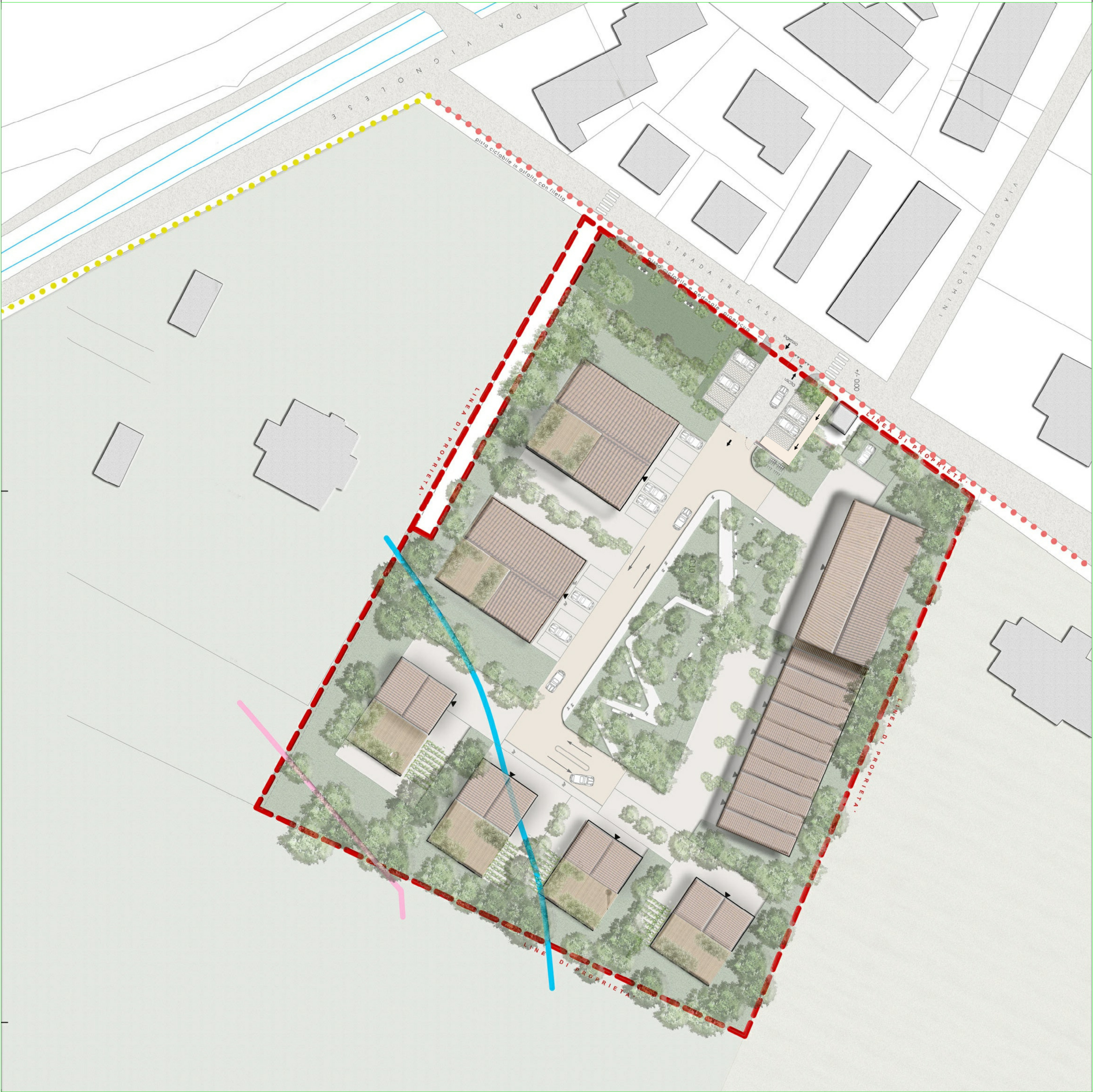
tavola PP.04.2 STATO DI PROGETTO M A S T E R P L A N